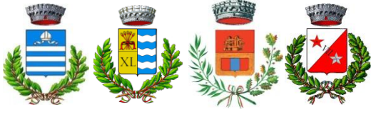
Andrate Carema Nomaglio Settimo Vittone